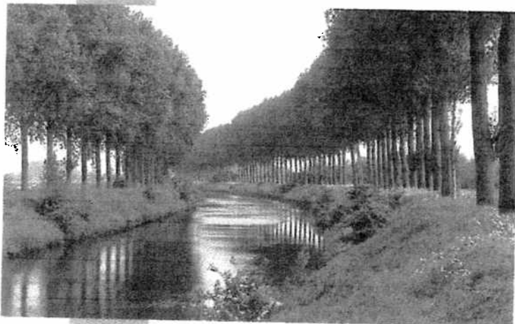
Het Schipdonkkanaal: één van onze schaarse plekjes van rust en verpozing !

De weg die Vlaanderen in deze bewandelt, is zeker niet het Vlaanderen dat de pioniers van de Vlaamse beweging ooit voor ogen hadden. Niet te verwonderen dat de huidige Vlaamse bewegingen verstarren en dood bloeden. Zij zijn blijven hangen in alleen meer Vlaanderen, de vraag naar welk Vlaanderen is voor hen blijkbaar te hoog gegrepen.